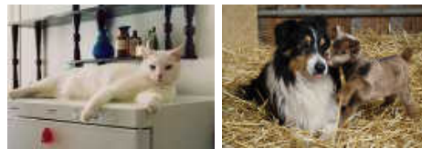
» Die Haustiere der Brandenburger

17.01.2013/ 10:30 Aufruf zum Ideenwettbewerb im Regionalbudget V: Vorbereitung und Coaching von Existenzgründenden über 28 Jahre