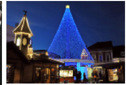
» Impressionen aus Potsdam