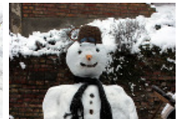
» Bilder aus Brandenburg und der Welt